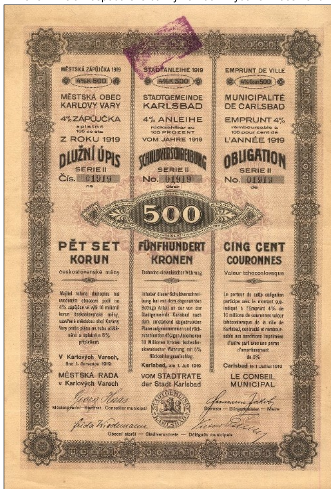
A2516 – Dluhopis města Karlovy Vary na 500 Kč vydaný v roce 1919