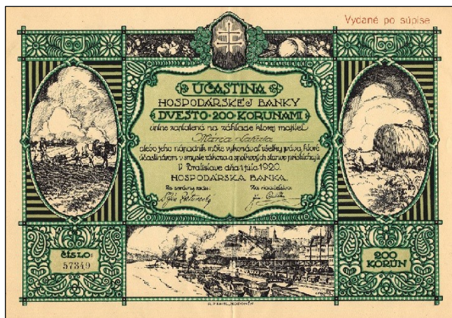
A2513 - Akcie Hospodářské banky na 200 K vydané v roce 1920