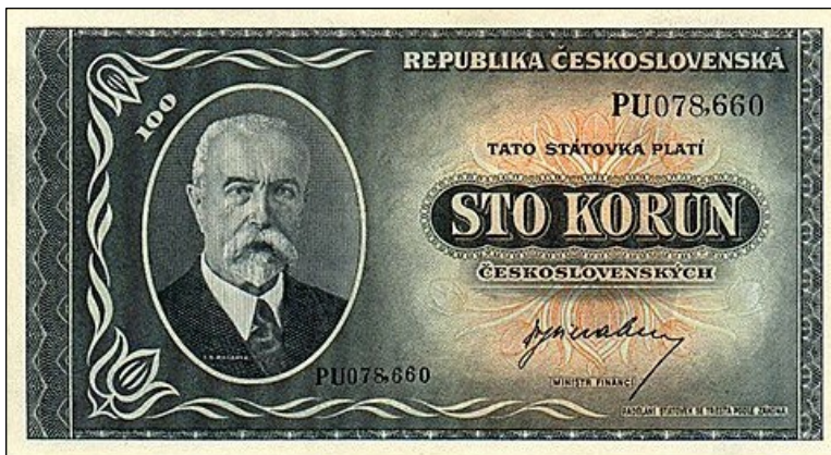
Bankovka 100 Kčs zavedená v roce 1945, tištěná ještě v Londýně během války