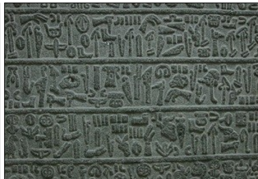
Bedřich Hrozný (1879-1952) a ukázka starého písma Chetitů na kamenné desce