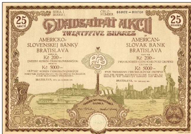
A2511 – 25 akcií Americko-slovenské banky vydané v roce 1921

Na téma karlovarských dluhopisů plánujeme do příštího ročníku článek, neboť to bude 5 let od vzniku této kauzy a tak nastane určitý odstup, nejen pro dění okolo kauzy, ale také na objektivní zpracování historických dat ke všem emisím města.