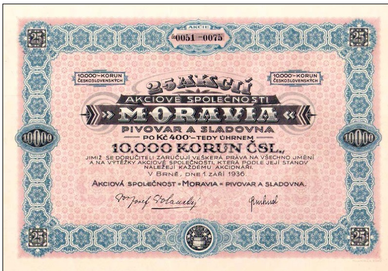
A2517 – 25 akcií Akciové společnosti „Moravia“, pivovaru a sladovny z roku 1936

Plány na různé články nám tu leží na stole a je vždy jen otázkou, jak se podaří dát všechno dohromady, aby byl každý článek natolik pestrý a zajímavý, že zaujme jak odbornou, tak zejména laickou veřejnost. Jedině tak se bude šířit popularizace oboru skripofilie a dějin průmyslu i mezi širokou veřejnost, což je účel jak muzea, tak těchto našich věstníků.